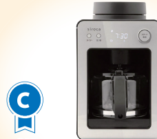
C SIROCA 全自動 コーヒーマーカー