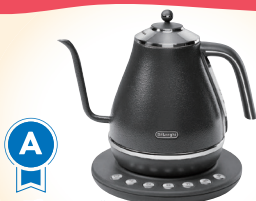
A デロンギ 電気カフ ケトル