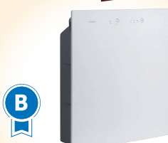
B ツインバード 空気清浄機