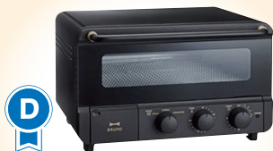
D BRUNO スチーム& ベイクトースター