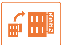
他行・他社からの借換