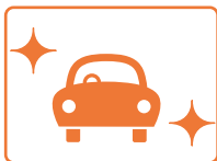
新車・中古車購入