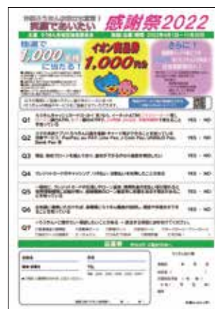
感謝祭面談シート