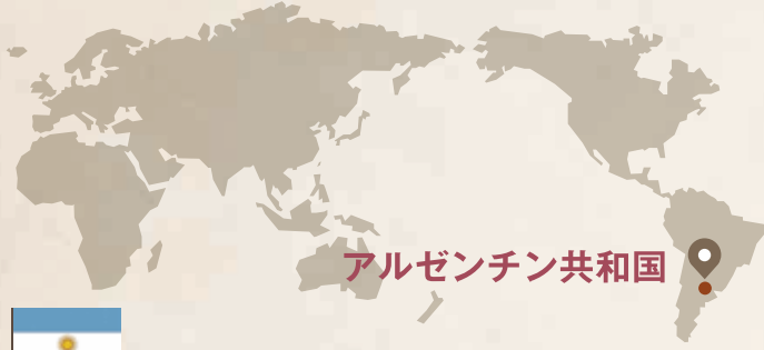
アルゼンチン共和国

雄大な自然に恵まれた世界遺産や、グルメ&ワイン、スポーツなどが楽しめる「アルゼンチン共和国」です。